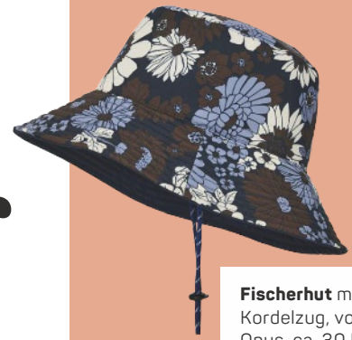
Fischerhut mit Kordelzug, von Opus, ca. 30 Euro

Erst mit den passenden Accessoires werden Ausflüge ans Meer, an den Badeseesee oder ins Freibad rundum perfekt