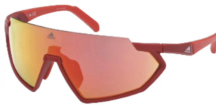
Sport-Sonnenbrille von Adidas, ca. 180 Euro